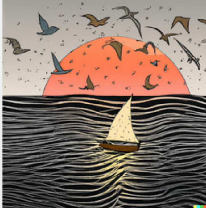
2 pav. Laivelis jūros bangose

Jei į darbą įterpiate DI sukurtą vaizdą, jį reikia pateikti pagal metodinių nurodymų reikalavimus, t.y. įrašyti paveikslo numerį ir pavadinimą, o skliausteliuose parašyti pateiktą užklausą (užduotą klausimą) DI įrankiui ir nuorodą į šaltinį.